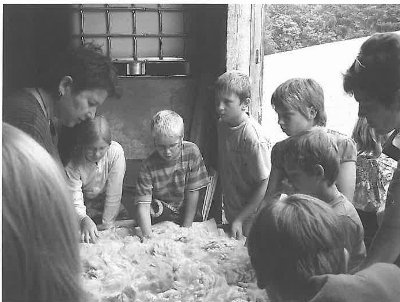
Unterricht in der Natur